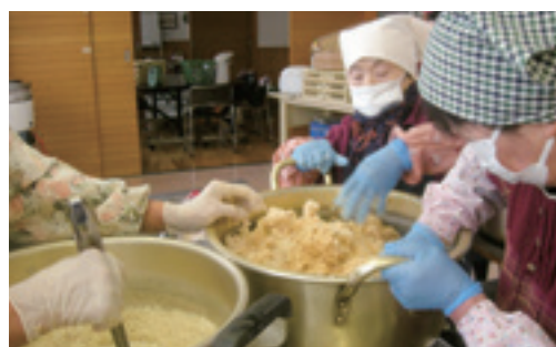
▲仕込み作業をする参加者

参加した部員は「毎年自分達で作る味噌はとても美味しく、毎年楽しみにしている」と話しました。また今回初めて参加された方からは「大豆をつぶしたり、こうじを混ぜたりと楽しく活動に参加できた」と大満足でした。