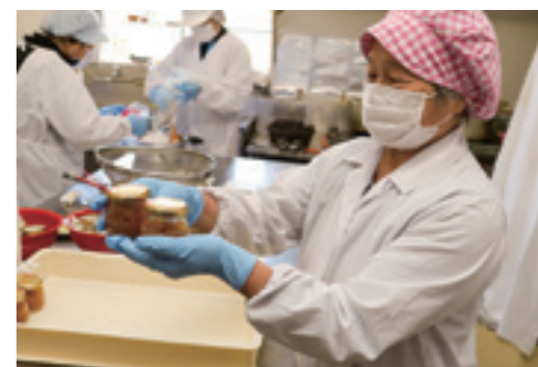
▲ラベルシールを貼るメンバー

三次市小田幸町の加工グループ「プロスピード井田加工所」のメンバーは3月14日、同町の加工所で「三次の春の香りセット」の発送に向け、マーマレードの瓶詰め作業を行いました。「三次の春の香りセット」作りは昭和59年からスタートし、今年で40年目。今年は新たに三次産の生姜を使用した大根のハリハリ漬け風醤油煮を取り入れました。メンバーは「今年も想いを込めて手づくりした三次の