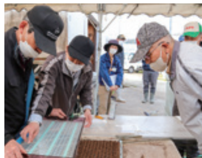
▲実践を交えながら種まきのポイントを説明する朝日営農指導員

研修会では、広島県北部農業技術指導所の職員が土づくりや排水対策、播種後の管理などを説明。営農指導員が育苗箱への種まきを演返し、1つ1つポイントを説明しました。参加者は「栽培管理を徹底し、昨年より質の良い白ねぎを作りたい」と話しました。朝日一秀営農指導員は