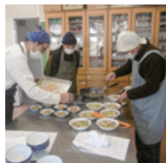
▲完成した料理を装う参加者

JA三次三良坂支店は3月3日、三良坂町の田利自治交流センターで男性料理教室を開き、5人が参加しました。 「家の光」に掲載されている料理を参考に、季節の旬の野菜を使った料理を楽しく学び、交流する場となっています。講師は同支店の生活担当が務め、支店長も参加するなど、「組合員との対話」の機会や地域活性化の取り組みにもなっています。今回は「豚肉とハクサイのはる